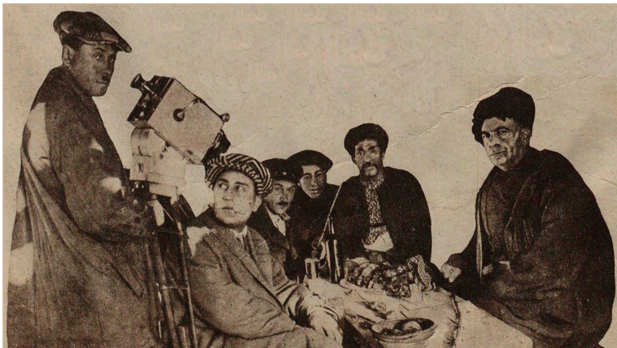
Илл. 3. На съемках «Зарэ»