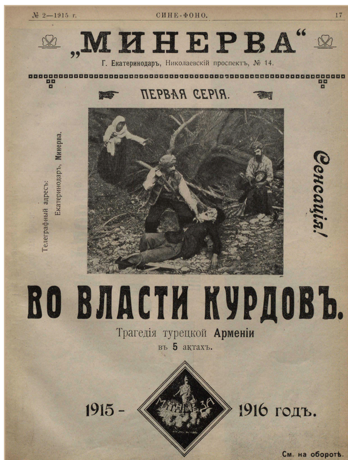
Илл. 1. Афиша «Во власти курдовъ»