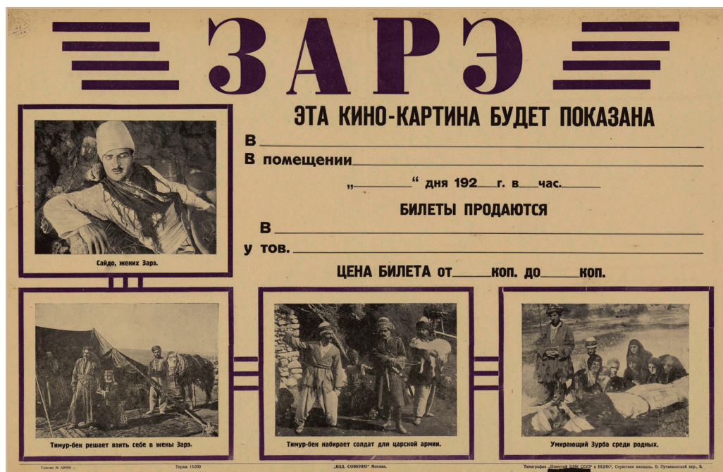
Илл. 2. Билет на фильм «Зарэ»