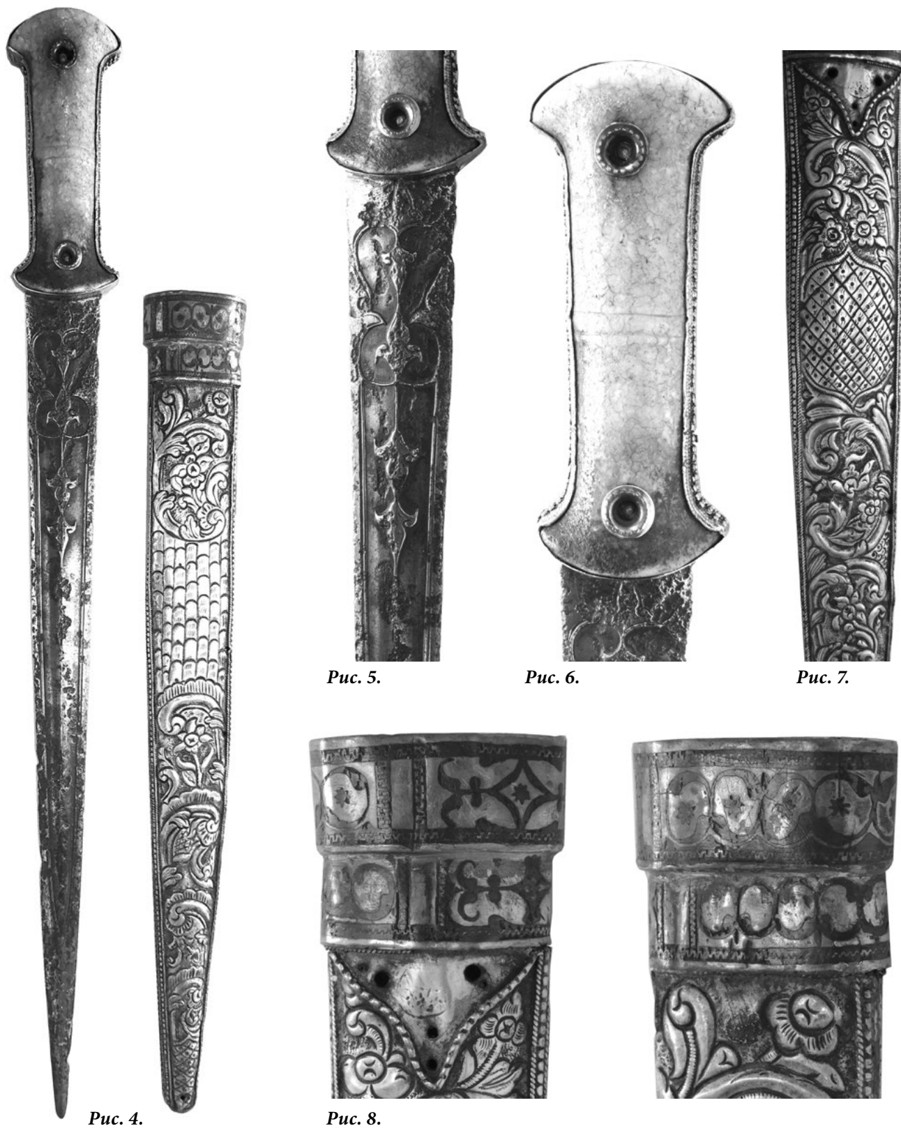
Рис. 4. Кинжал с ножнами из коллекции музея Рязанский Кремль